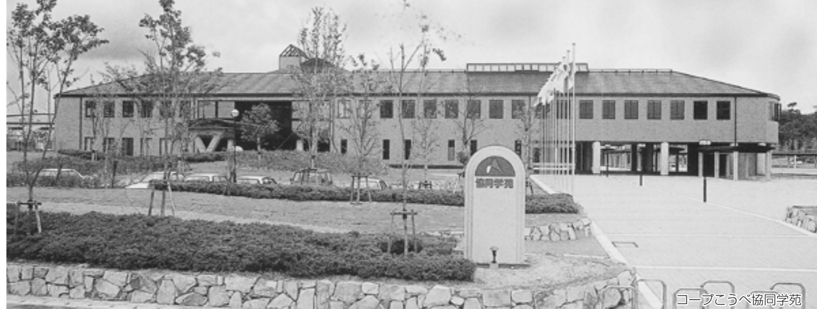
コープこうべ協同学苑