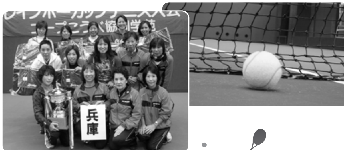
昨年度の団体優勝チーム〔兵庫県〕の皆さん