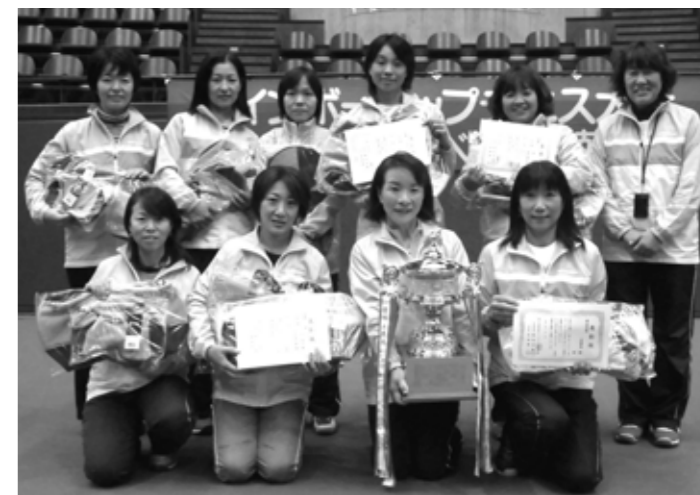
昨年度の団体優勝チーム(京都府)の皆さん