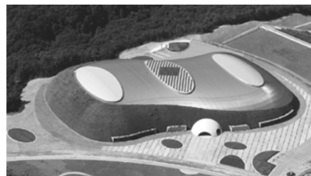
決勝大会会場：ブルボン ビーンズドーム